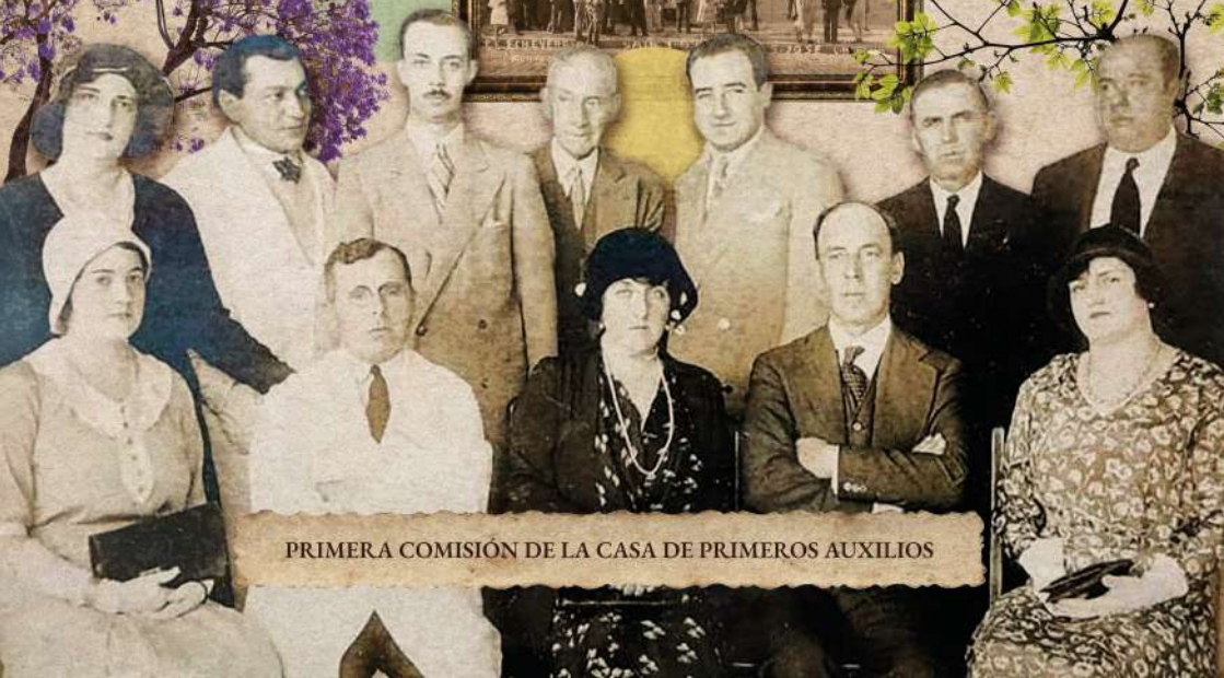
PRIMERA COMISIÓN DE LA CASA DE PRIMEROS AUXILIOS